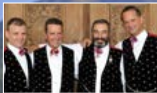
Konzert mit dem Männerquartett Kastelruth